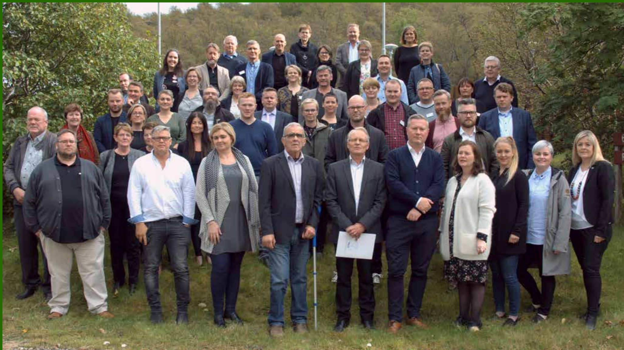
Fulltrúar á aðalfundi SSA 7.-8. september 2018.