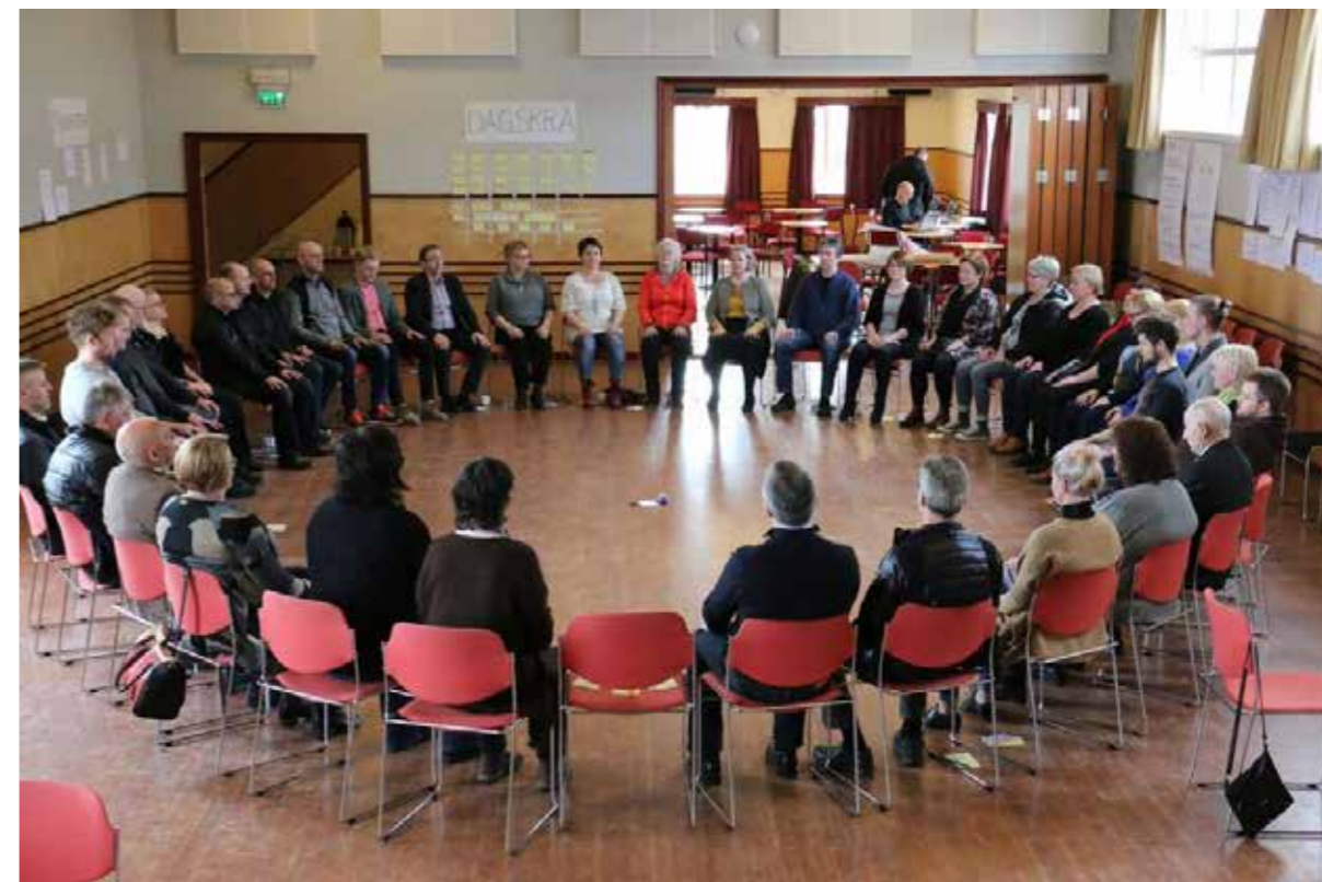
Frá málþingingu Veljum Vopnafjörð í júní 2016.

Í júní 2016 var haldinn íbúafundur þar sem greint var frá skilaboðum þingsins og rætt var um framhaldið. Nokkrar hugmyndir komust strax til framkvæmda vorið og sumarið 2016. Haustið 2016 fundaði verkefnisstjórn með nemendum framhaldsdeildar, frumkvöðlum og loks sveitarstjórn sem skoðaði skilaboð íbúafundings í tengslum við gerð fjárhagsáætlunar. Verkefnið stendur í rúmlega eitt ár og lýkur því haustið 2017.