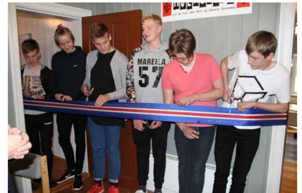
Formleg opnun framhaldsskóladeildarinnar á Vopnafirði 8. september 2016.

Nemendurnir eru á staðnum alla virka daga og kennt er í fjarkennslu eða með verkefnavinnu. Eina viku í mánuði fara nemendurnir á Lauga til að taka þátt í skólalífni, hitta kennara o.fl.