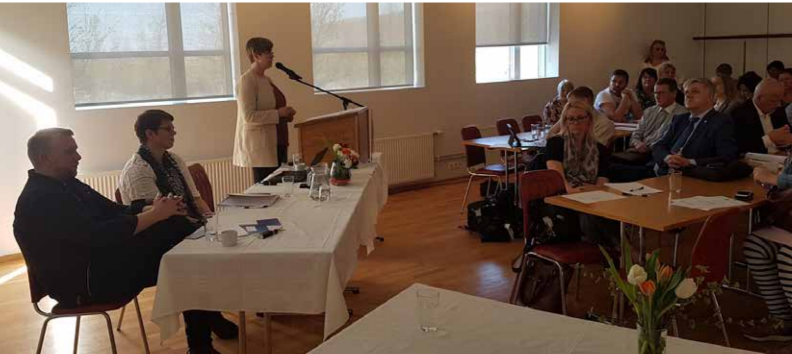
Ársfundur Austurbrúar var haldinn í Végarði í Fljótsdal. Í beinu framhaldi af honum fór fram málþing um húsnæðismál á Austurlandi.

Stjórn Austurbrúar hélt 12 fundi á árinu og má finna fundargerðir árs- og stjórnarfunda á heimasíðu hennar. Nánari upplýsingar um fjármál og rekstur Austurbrúar 2017 má finna í ársreikningi sem einnig er að finna á heimasíðunni.