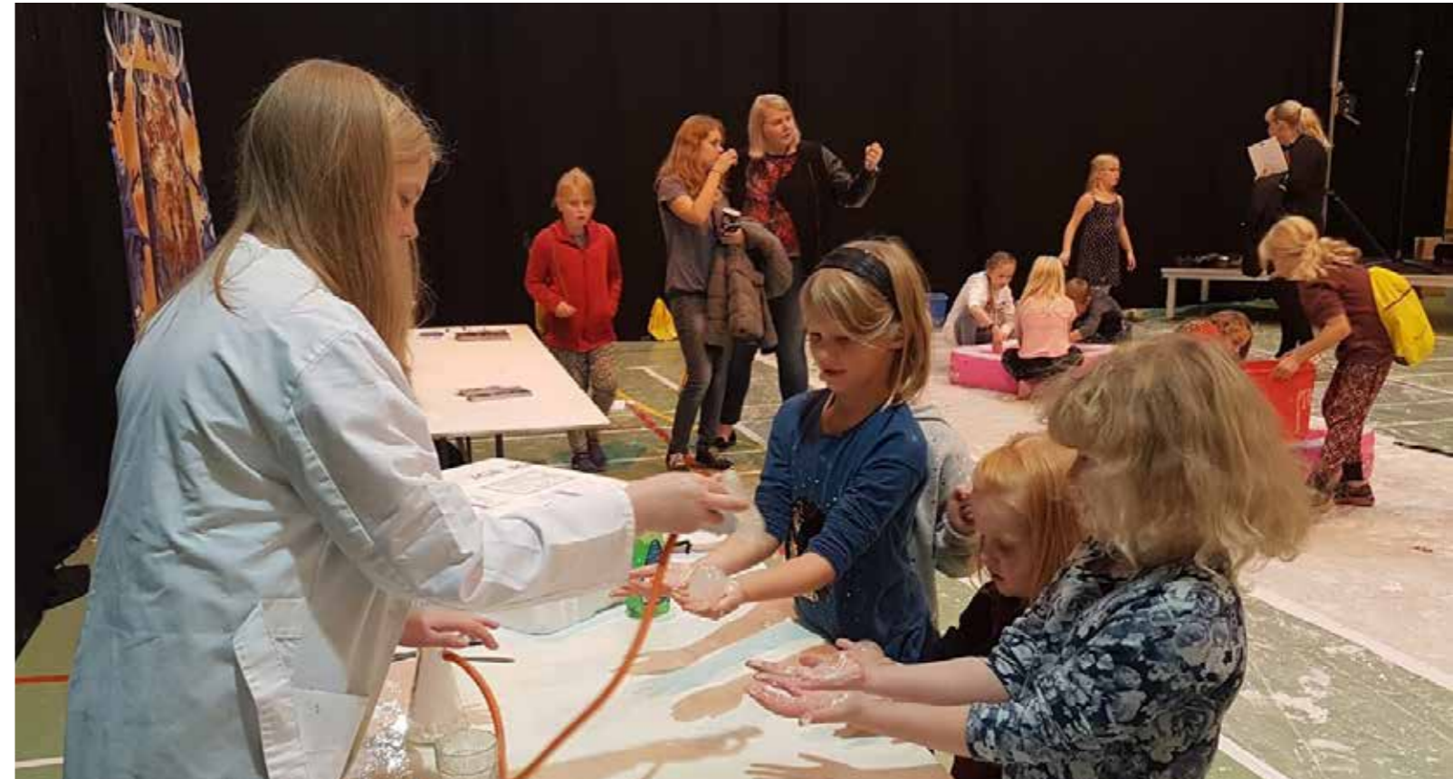
Frá Tæknidegi fjölskyldunnar sem haldin er árlega í Neskaupstað.

Tæknidagur fjölskyldunnar var haldinn í fimmta skiptið í Verkmenntaskóla Austurlands þann 7. október 2017. VA og Austurbrú standa að deginum sem er orðinn einn af stærstu viðburðum ársins á Austurlandi. Markmið Tæknidagsins er að vekja áhuga almennings á fjölbreyttum og spennandi viðfangsefnum tækni, verkmennta og vísinda og örva sköpunargleði. Fyrirtæki, stofnanir og frumkvöðlar kynna starfsemi sína og er dagskráin sniðin að öllum aldurshópum. Um 1200 gestir skráðu sig í gestabækur, en þátttakendur í deginum voru á annað hundrað frá um 40 fyrirtækjum og stofnunum.