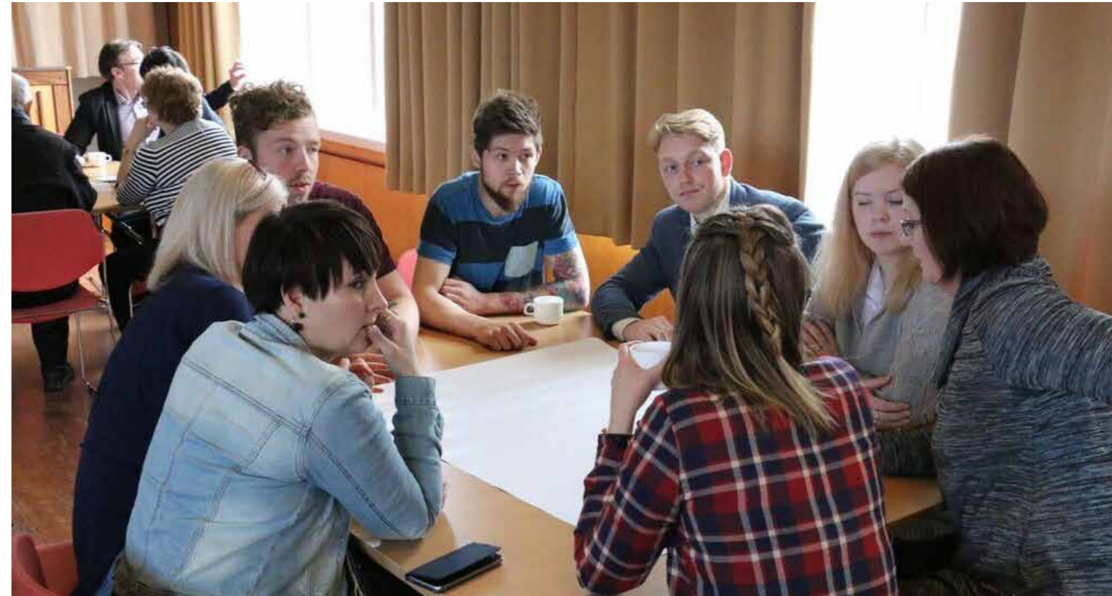
Frá vinnufundi verkefnastjórnar í Veljum Vopnafjörð haustið 2017.