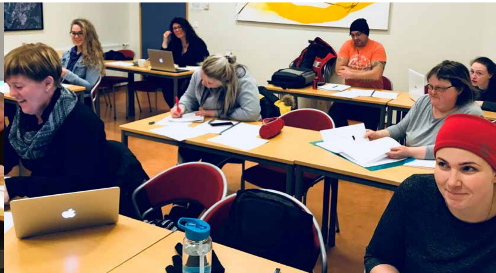
Frá kennslu í menntastoðum í Vonarlandi á Egilsstöðum.

Námsleiðin Menntastoðir hófst um miðjan september. Til að koma til móts við íbúa í dreifbýli var námsleiðin kennd í fjarnámi. Árangur haustannar var góður og ekkert brottfall nemenda. Kennarar setja námsefni hvernar viku, þ.e. fyrirlestra, lesefni og verkefni, inn á vefsvæði þar sem þátttakendur geta nálgast það og skila svo verkefnum sínum þangað inn. Almennt eru þátttakendur ánægðir með fyrirkomulagið og segja það henta vel með vinnu og fjölskyldulífi.