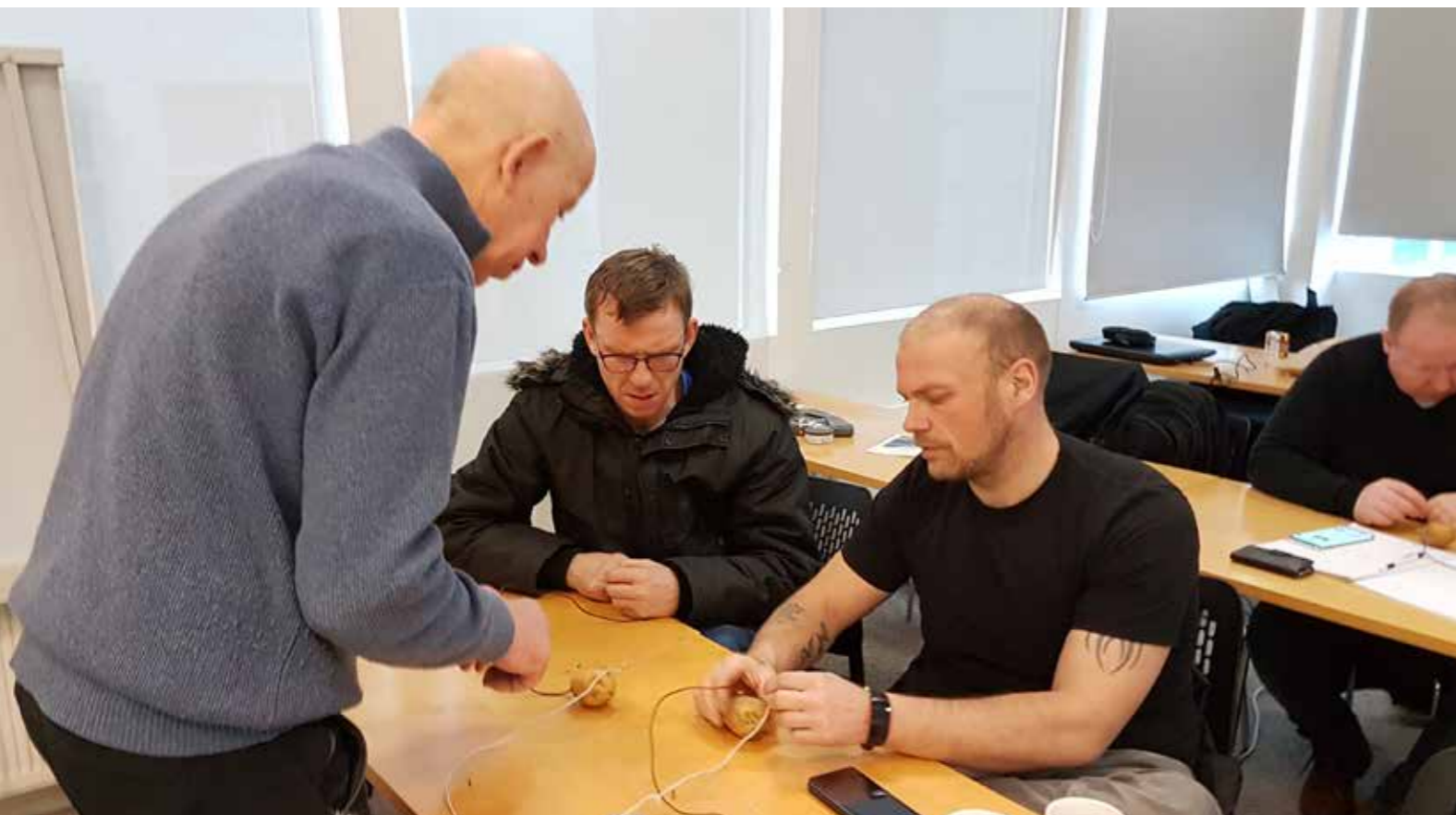
Frá kennslu í Stóriðjuskólanum í Fróðleiksmolanum á Reyðarfirði.