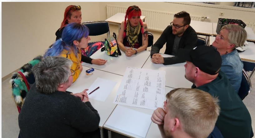
Mynd 2 - 4: Íbúafundir