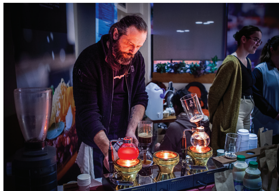
Efri mynd: Sköpunarmiðstöðin á Stöðvarfirði. Neðri mynd: Kaffi Kvörn kynnis vörur sínar á Matarmóti.