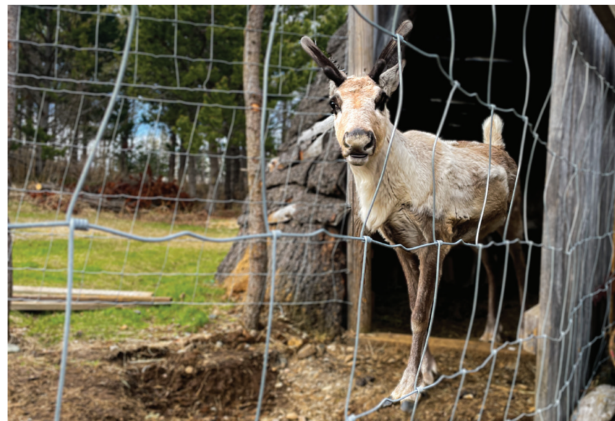
Efri mynd: Austurland Freeride Festival er árleg fjallaskíða- og snjóbrettahátíð á Austurlandi. Neðri mynd: Hreindýragarðurinn í Vínlandi er sá eini sinnar tegundar á Íslandi.