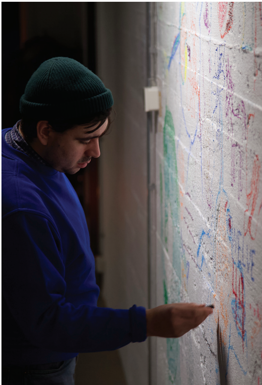
Frá starfi Lunga skólans.