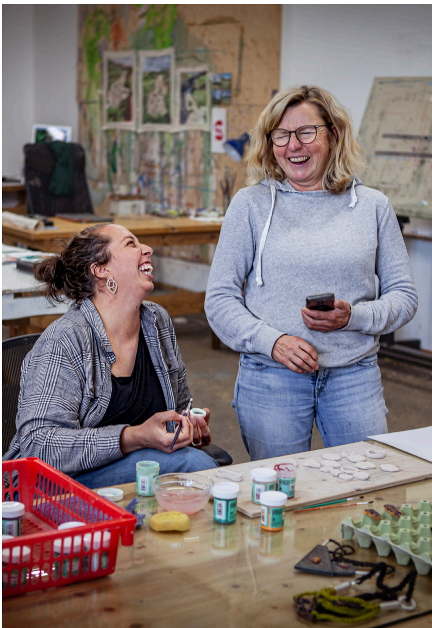
Frá Sköpunarmiðstöðinni á Stöðvarfirði.