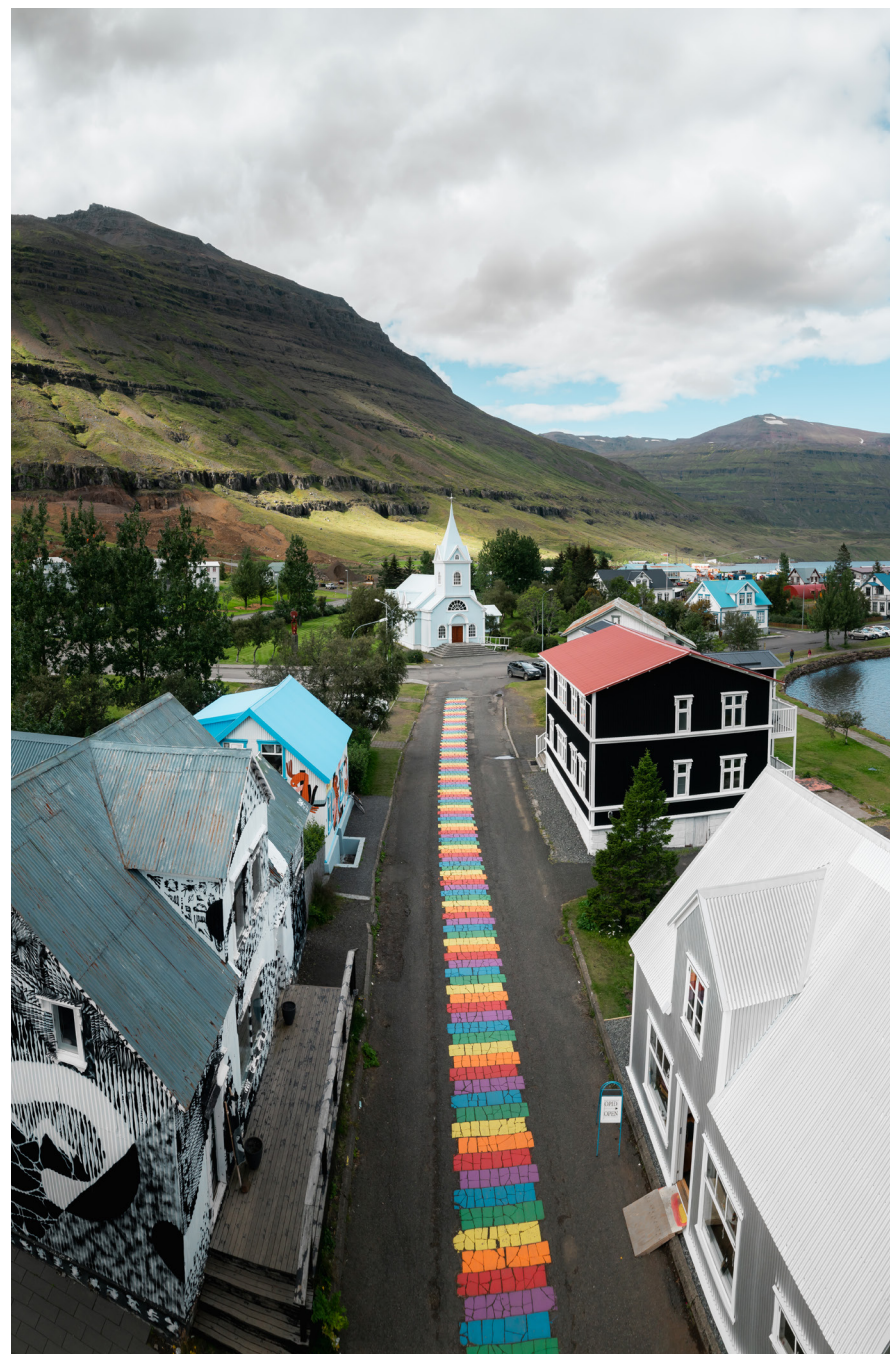
Bláa kirkjan á Seyðisfirði.

Markmið verkefnisins er að kanna og meta eftirspurn og rekstrargrundvöll sjálfstæðrar svæðisbundinnar dagskrágerðar fyrir hljóðvarp (útvarp og hlaðvarp). Tilgangurinn er að efla dagskrármíðlun af og innan Austurlands og að fyrir mitt næsta ár muni liggja fyrir raunhæf áætlun um hvernig hægt sé að reka sjálfstætt hljóðvarp í landshlutanum sem fyrst og fremst höfðar til íbúa Austurlands.