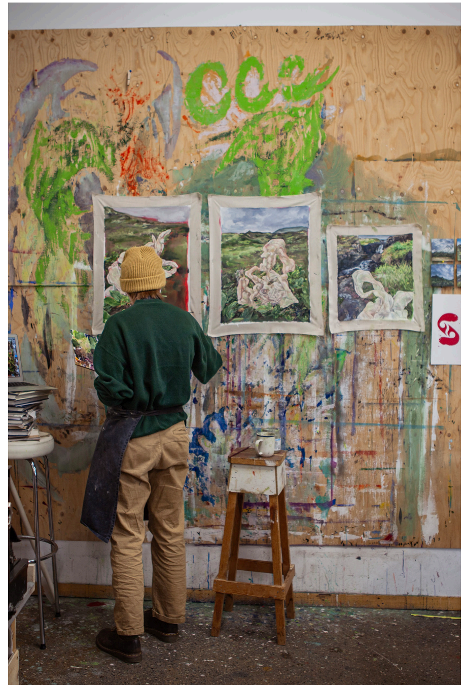
Úr Sköpunarmiðstöðunni á Stöðvarfirði.

The Winterland is a 5-7 day long program for adventurous people that want to take time away from the crowds, enjoying various winter activities, fine dining and relaxation on their time off from everyday life focusing on being in the moment surrounded by nature, enjoying local cuisine, having a soak at nature baths, doing mindfulness exercises or just hanging around at the hotel lounge or the bar.