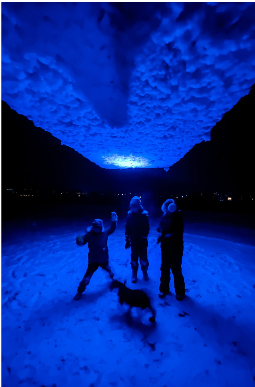
List í ljósi 2024.